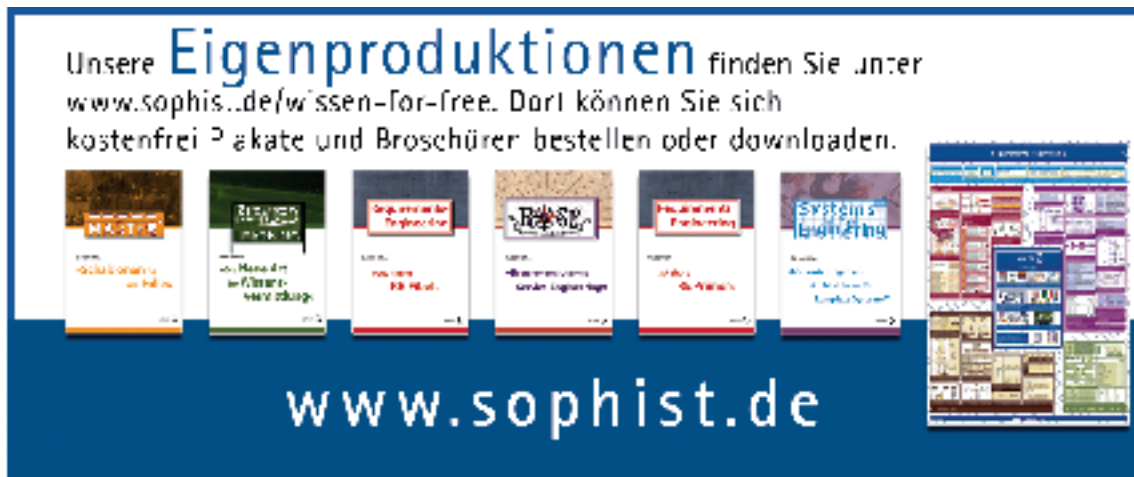
Abbildung 2: Marketing für Marketingartefakte – Ausschnitt aus dem UML 2 Plakat von SOPHIST

Flyer oder Handouts dagegen, dienen den unterschiedlichen Rollen in Ihrem Prozess als Nachschlagewerk, welche wichtigen Punkte sie in ihrer Arbeit beachten müssen. Möchten Sie beispielsweise in Ihrem Prozess das SOPHIST Regelwerk in Ihrem RE-Prozess etablieren, so eignet sich ein Flyer, der eine Übersicht über die verschiedenen Regeln bietet. Weisen Sie Ihre Nutzer auch darauf hin, wo sie weitere Informationen zu den einzelnen Regeln finden können. Auch Informationsbroschüren erfüllen einen ähnlichen Zweck, gehen bei den Inhalten allerdings wesentlich mehr in die Tiefe als ein Flyer. Ein Beispiel hierfür sind die Informationsbroschüren von SOPHIST, die Sie in Abbildung 2 sehen können. Die Abbildung ist ein Ausschnitt aus unserem bereits erwähnten UML 2 Poster. Denn damit Ihr Zielpublikum auch von den hilfreichen Informationen erfährt, die Sie ihm zur Verfügung stellen, müssen Sie manchmal Marketing für Ihre Marketingartefakte machen.