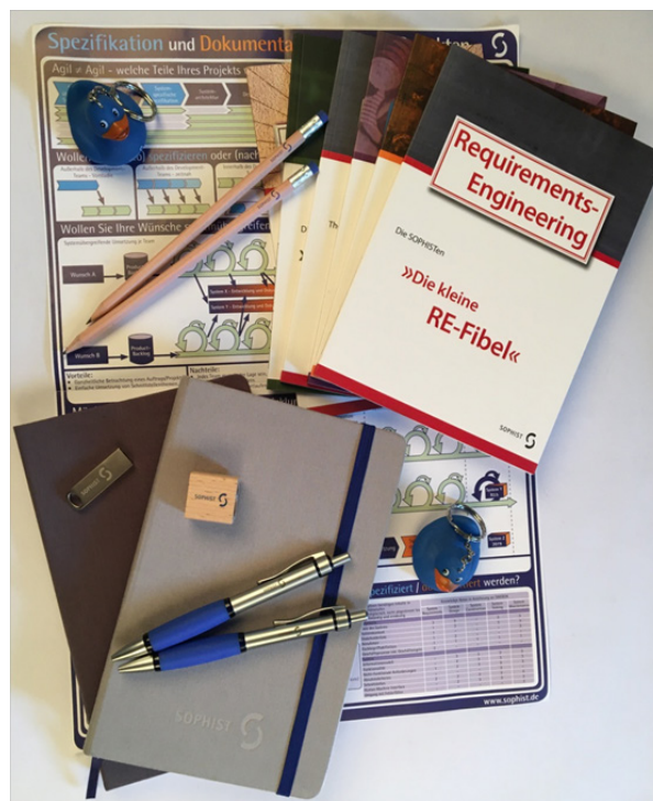
Abbildung 4: Auswahl der Marketingartefakte von SOPHIST

Produktmessen verbinden im Grunde die Punkte Vortrag, Infoveranstaltung und Workshop. Wichtig ist hier das Pullprinzip der Informationsverbreitung: Sie schaffen ein breitgefächertes Angebot an Informationsmöglichkeiten und überlassen es Ihrem Zielpublikum, sich die Teile anzuschauen, die es interessiert. Der Informationsfluss ist damit von Person zu Person unterschiedlich und wesentlich divergenter als das beispielsweise bei einem Vortrag der Fall ist. Dies erlaubt es den Teilnehmenden je nach Interesse unterschiedlich tief in das Thema einzusteigen. Die Produktmesse erlaubt es Ihnen mehrere Marketingziele gleichzeitig zu verfolgen. Von Interesse wecken über organisatorische und inhaltliche Informationen zu Ihrem Projekt ist alles möglich, solange die von Ihnen bereitgestellten Informationen ausreichend heterogen sind. Eine Produktmesse bedeutet einen hohen organisatorischen Aufwand und lohnt sich erst, wenn Sie ein Produkt oder Prototypen zum Vorstellen haben. Ihre Projektergebnisse sollten also bereits einen gewissen Reifegrad aufweisen.